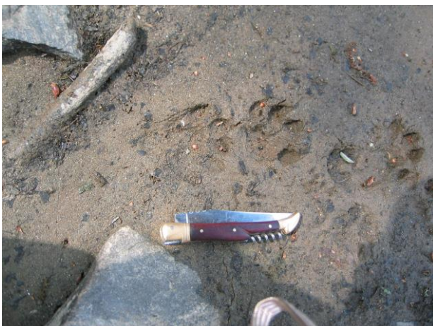
Empreinte de Loutre d'Europe