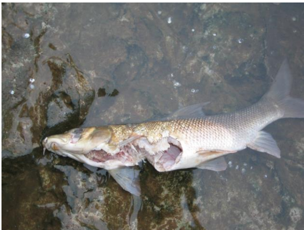
Prédation sur un Barbeau